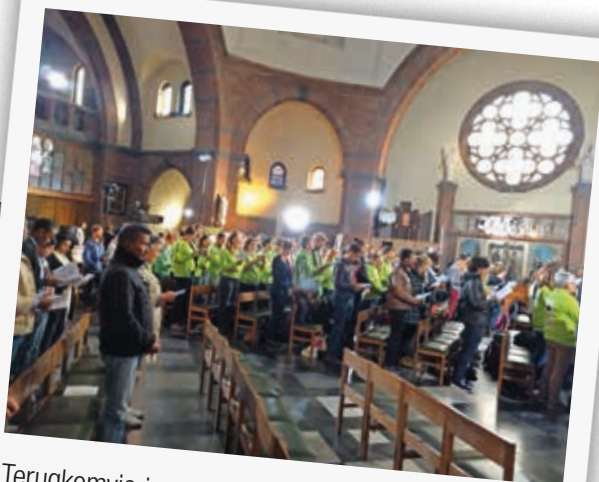
Terugkomviering na de WJD in Krakau.