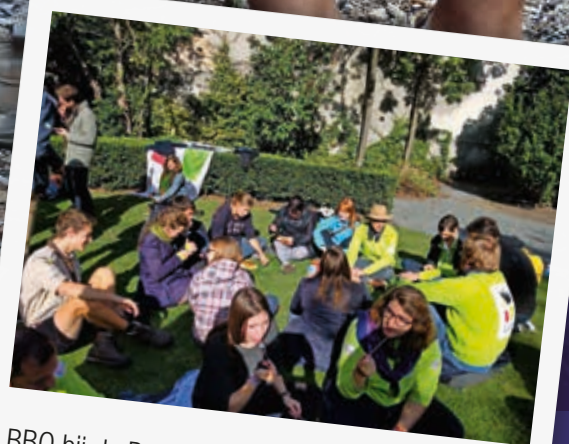
BBQ bij de Poolse gemeenschap.

Jongerenpastoraal IJD - Antwerpen • ijdontwerpen@ijd.be • 03 454 11 44