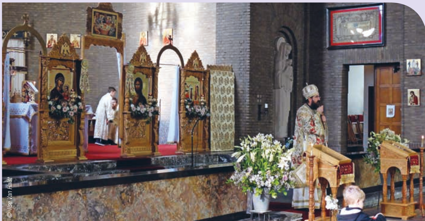
➤ De Roemeens-orthodoxe christenen vonden een eigen stek in de kerk Onze-Lieve-Vrouw van de Rozenkrans in Wilrijk.