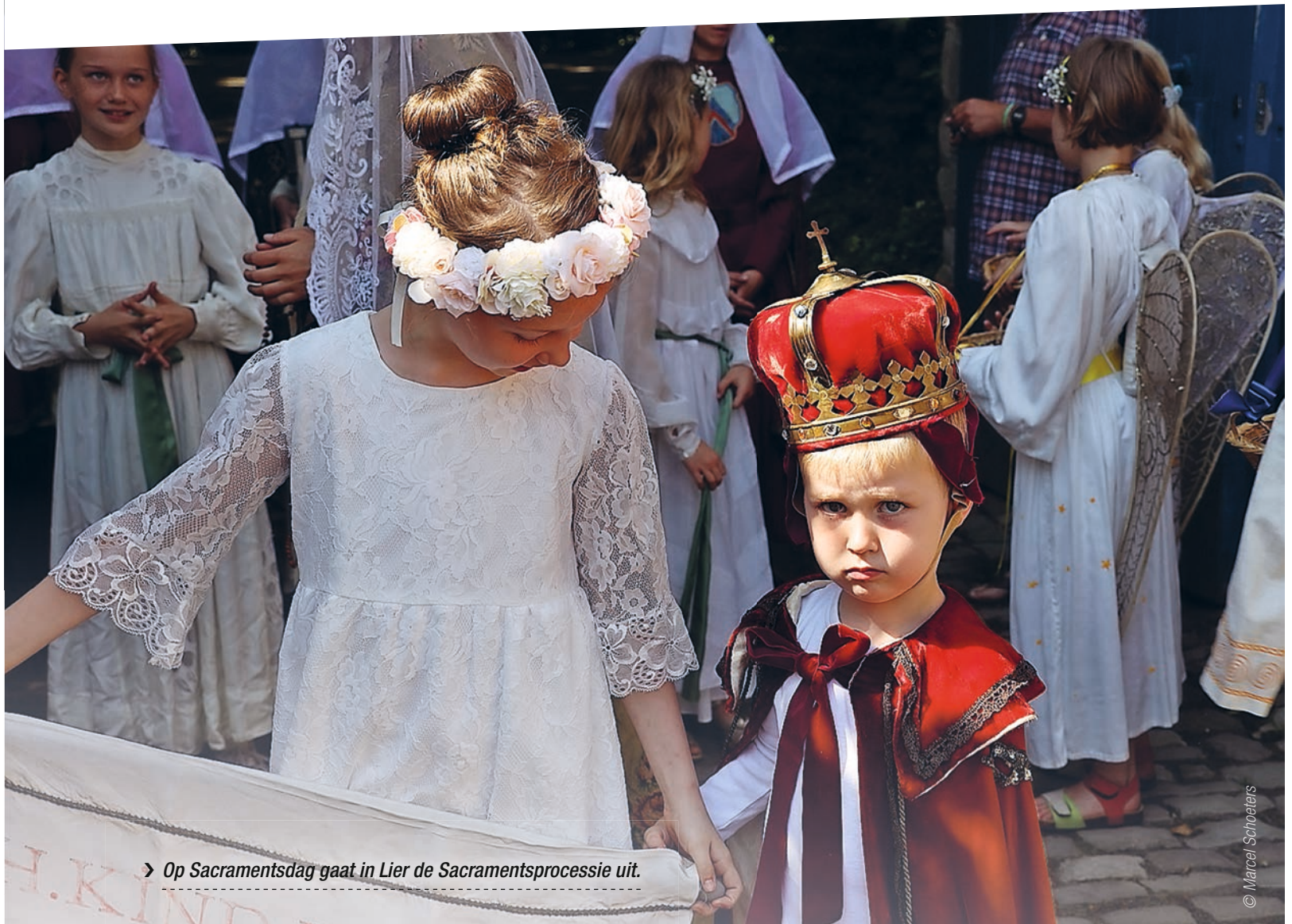
› Op Sacramentsdag gaat in Lier de Sacramentsprocessie uit.

NA EEN PERIODE VAN NEERGANG HERLEVEN DE VOORBIJE JAREN HEEL WAT PROCESSIES. ALS FOLKLORISTISCH CURIOSUM? ALS FEEST VAN VERBINDING? ALS KANS TOT VERKONDIGING?