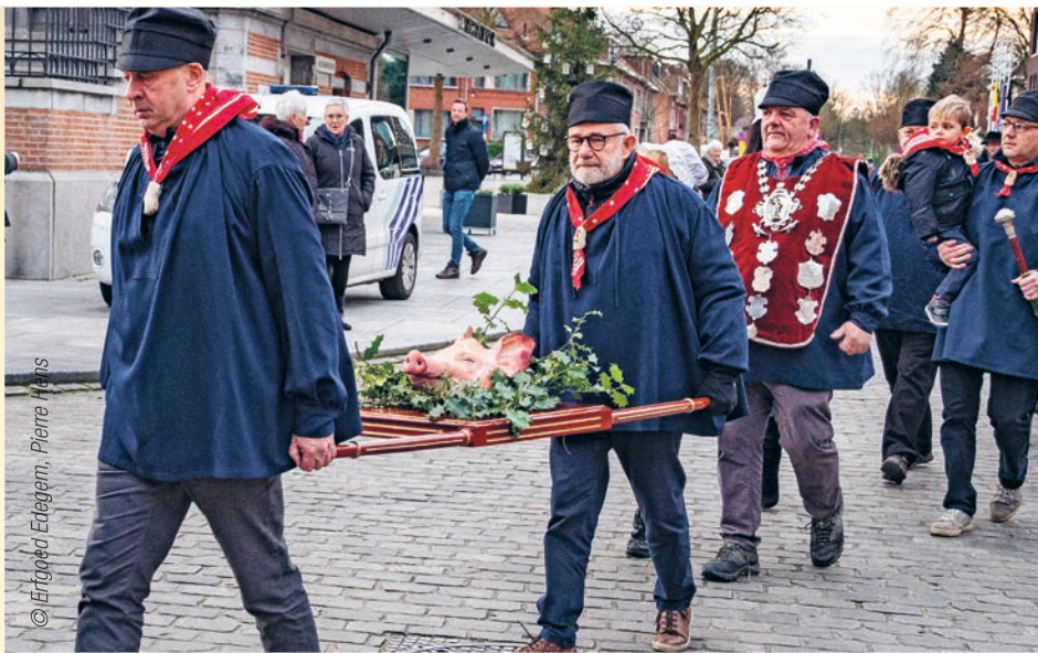
› Na de processie en de eucharistieviering wordt de varkenskop verkocht bij opbod. Symbolisch, want om voedselveilige redenen krijgt de koper een kilo geperste kop mee huiswaarts.