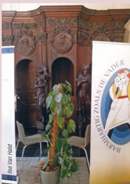
➤ In een afgeschermd hoek in de Sint-Antoniuskapel in de Onze-Lieve-Vrouwekathedraal kun je elke dag terecht om te biechten van 15 tot 15.30 uur.