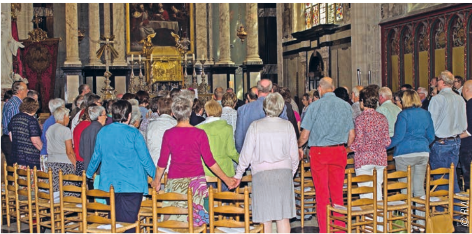
› Elk jaar komen de pastoraal werkers en werksters samen om te vieren.

Hadden in het begin enkel ongehuwde vrouwen toegang tot het nieuwe ambt van pastoraal werk(st)er, later zal de opleiding opengesteld worden voor mannen en gehuwden. Het is maar een van de vele veranderingen in de geschiedenis van de opleiding tot pw. "Eind september 1969, bij de opstart van de opleiding, gaf ik de eerste lessen aan de pastoraal werksters in Villers in Schoten, vijf religieuzen en één leek. Ik was nog jong