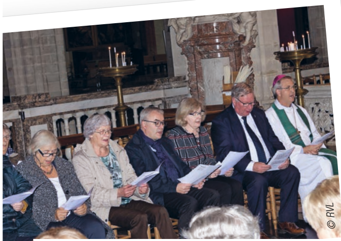
► Elk jaar nodigt de bisschop alle pastoraal werk(st)ers uit in de kathedraal om hen te danken en samen God te danken. Nadien is er steeds een gezellig samenzijn op de zolder van het bisschopshuis. Hier foto's uit de gebedsdienst op 6 oktober 2019.

Ze vervolgt "Bovendien wordt een en ander ook sterk gekleurd door de lokale situatie. Op de plek waar ik me inzet, kan ik prima samenwerken met priesters en diakens en heb ik het gevoel dat ik als evenwaardig en gelijkwaardig erkend word. Helaas is dat niet overal zo. En de eerlijkheid gebiedt ons te zeggen dat dat in de twee richtingen speelt. Tegelijk is het belangrijk