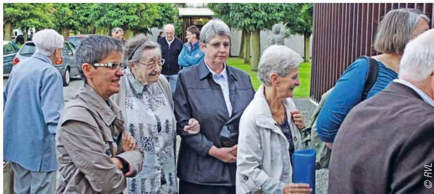
➤ Pastoraal werk(st)ers stromen in grote getale toe voor de viering van 40 jaar pw op 30 september 2012 in het TPC.