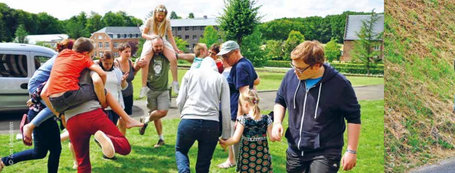
➤ Gezinsvakantie in Averbode: tijd voor verdieping, bezinning, gebed en tijd voor elkaar.

Soms zijn beproevingen meer dan een uitdaging. Soms gaan ze ons kunnen te boven. Er zijn tal van situaties die maken dat wij niet kunnen zijn wie we zouden willen zijn. Ziekte, financiële zorgen, ruzie in de familie, besluiteloosheid, werkloosheid, een onvervulde partner- of kindervens, gebrek aan erkenning en waardering kunnen ons zwaar belasten, onze standvastigheid tegenover onze roeping doen wankelen of onze zending een andere invulling geven.