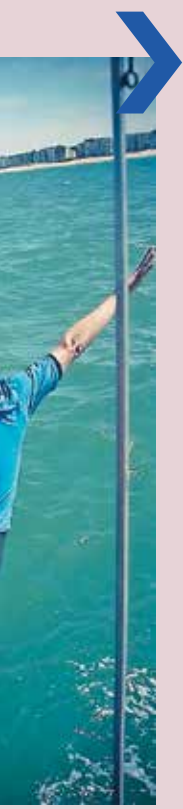
wagen de sprong.