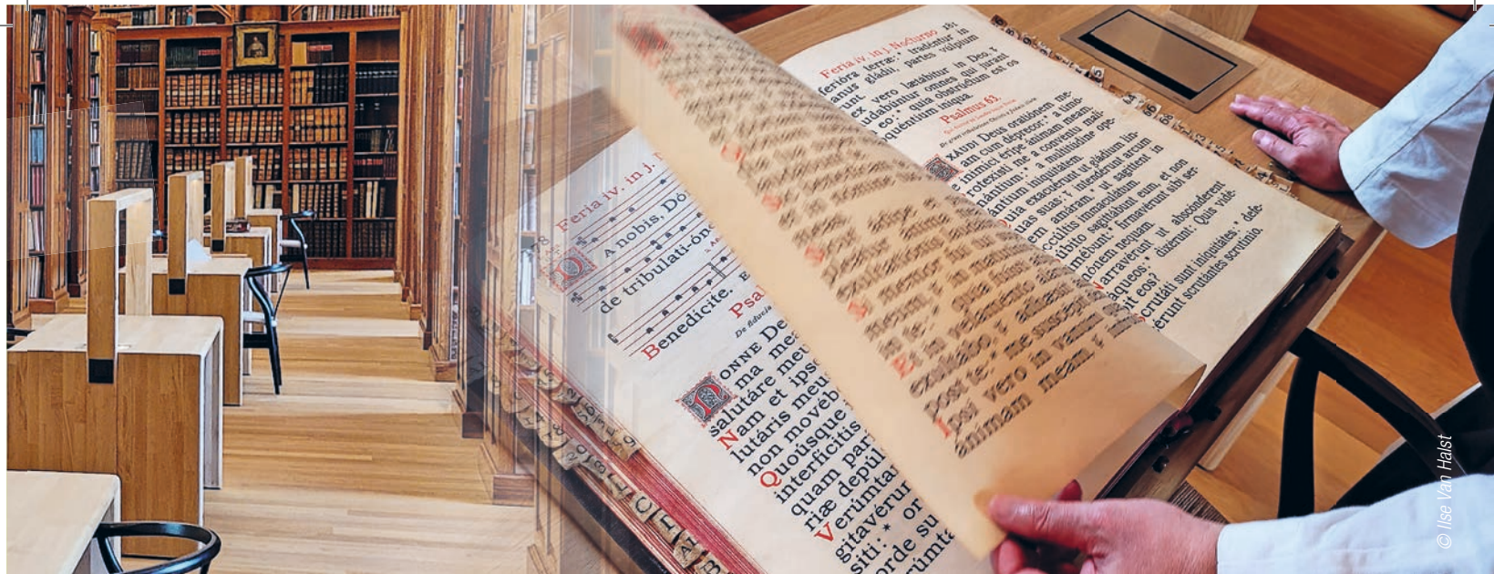
➤ Broeder Benedikt bladert in een oud koorboek, in koper gedrukt in de abdij van Westmalle. Vroeger bezat ze een eigen drukkerij voor Latijnse teksten.