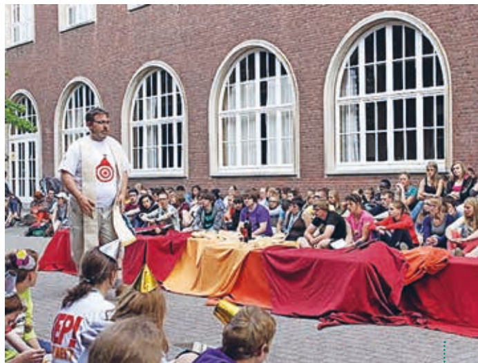
Een groot team van vrijwilligers biedt jongeren op het zomerse kamp JEP!? een mix van spel en geloof, genieten en ontmoeten.

Meer info over deze avond en over het hele weekend vinden jullie op www.ijd.be/antwerpen .