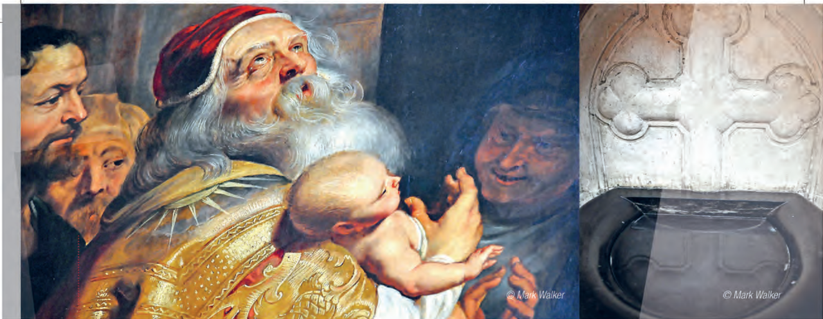
Hogepriester Simeon draagt de kleine Jezus, die zoals elk joods jongetje veertig dagen na zijn geboorte opgedragen wordt aan God. Te bewonderen in de Onze-Lieve-Vrouwekathedraal op het rechterzijpaneel van de 'Kruisafneming' van Pieter Paul Rubens.