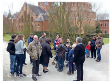
© J. J. J. J. J.

Wil je meer uitleg, raad vragen of eens van gedachten wisselen? Zend een e-mail naar ijdanwerpen@ijd.be en we helpen je graag verder.