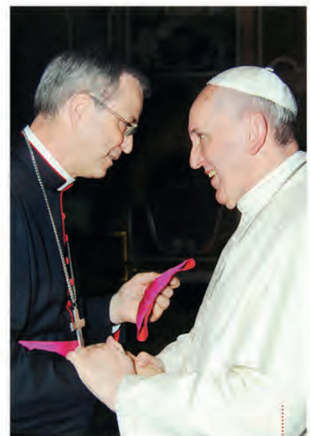
Mgr. Johan Bonny bij paus Franciscus.