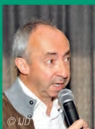
De regie is in handen van Stijn Coninx.