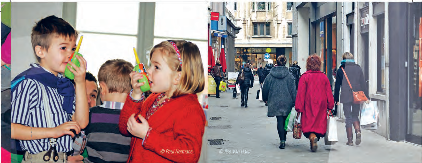
Verbonden zijn. 'Virtueel' is het in, maar ook in het echte leven hunkeren mensen naar gezelschap.

en via Facebook riepen 'vrienden' elkaar op om mee te doen. Ook in 2012 en 2013 wist de actie heel wat Vlamingen te mobiliseren.