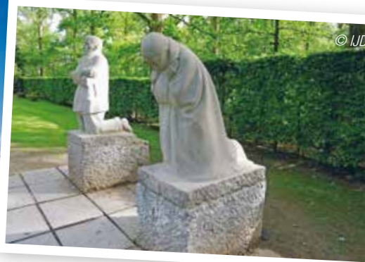
Een Duits kerkhof in Vladslo. Ook zij verloren hun zoon.

Info: Jongerenpastoraal IJD - Antwerpen, ijdontwerpen@ijd.be of 03 454 11 44.