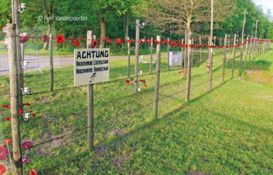
De 'dodendraad' moest verhinderen dat mensen de grens tussen Nederland en België overstaken.