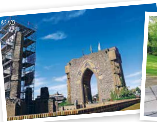
Vlaams nationalisme of oproep tot vrede?