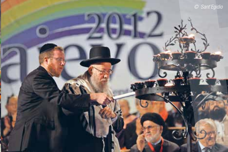
Op de slotmanifestatie ontsteken de verschillende vertegenwoordigers van de godsdiensten één voor één een kaars voor vrede. Hier op de Internationale Vredesontmoeting in 2012 in Sarajevo.