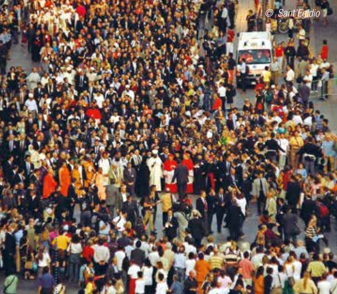
Na het vredesgebed trekt iedereen in een bonte stoet naar de slotplechtigheid. Hier op de religieuze vredestop in 2004 in Milaan.