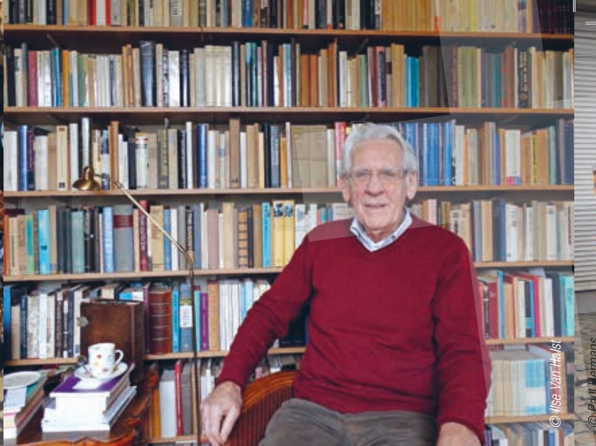
Wie echt wil zien, moet soms wat moeite doen.