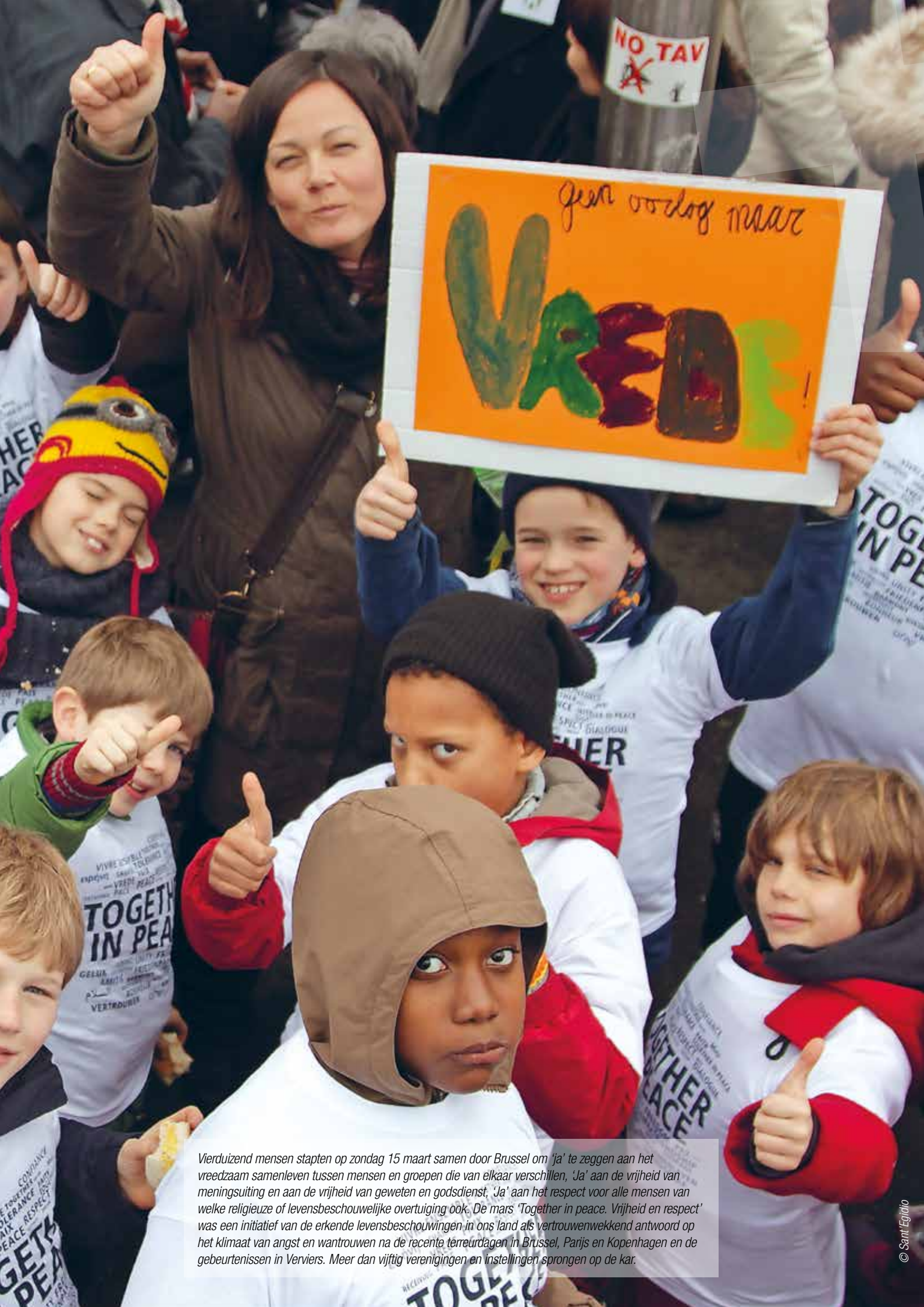
Vierduizend mensen stapten op zondag 15 maart samen door Brussel om 'ja' te zeggen aan het vreedzaam samenleven tussen mensen en groepen die van elkaar verschillen, 'Ja' aan de vrijheid van meningsuiting en aan de vrijheid van geweten en godsdienst, 'Ja' aan het respect voor alle mensen van welke religieuze of levensbeschouwelijke overtuiging ook. De mars 'Together in peace. Vrijheid en respect' was een initiatief van de erkende levensbeschouwingen in ons land als vertrouwenwekkend antwoord op het klimaat van angst en wantrouwen na de recente terreurdagen in Brussel, Parijs en Kopenhagen en de gebeurtenissen in Verviers. Meer dan vijftig verenigingen en instellingen sprongen op de kar.