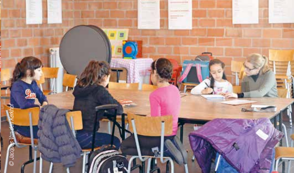
Een enthousiast deelnemer aan het convenant, een project voor nieuwkomers in het EVA-centrum..