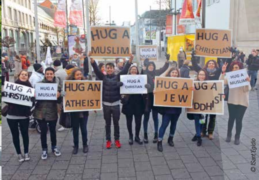
Jong geleerd is oud gedaan.