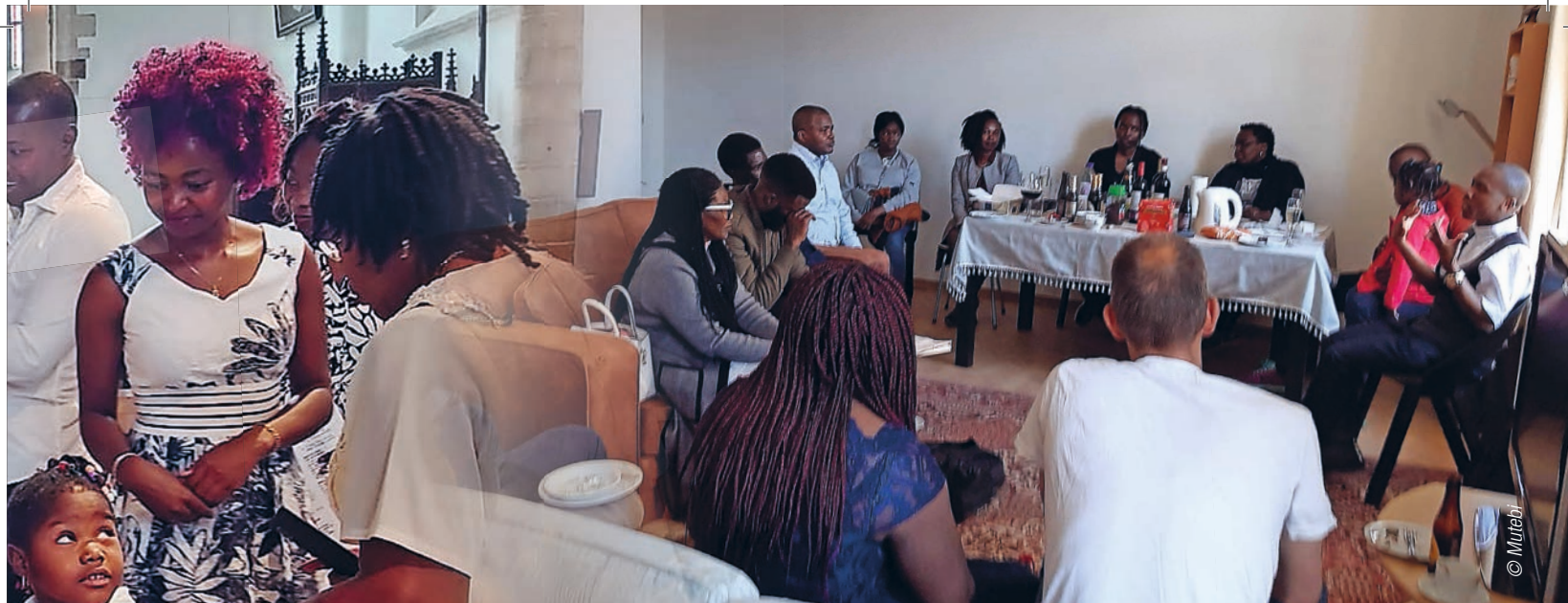
➤ Napraten bij een kop koffie en wat lekkers na de eerste internationale viering in Geel op 17 april 2022.