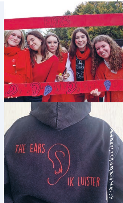
► Herkenbaar aan hun T-shirt of -trui en hun rode sjaal op donkere winterdagen zijn de Ears aanspreekbaar op de speelplaats van het Sint-Jozefsinstituut in Borsbeek, in de gangen en in het Earslokaal.