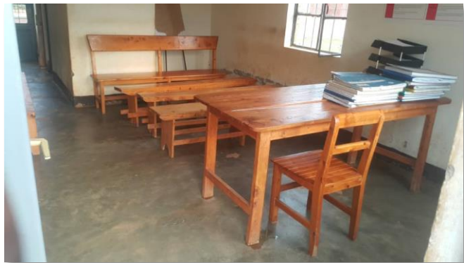
de kleine bestaande wachtzaal

* Voor de handhygiëne is de bestaande voorziening, een bekken dat handmatig met water moet gevuld worden, compleet ontoereikend. Voorziening van zuiver drinkwater is een noodzaak zowel voor zieken, personeel, als bezoekers. De volumes lopen op met het aantal patiënten dat hier dagelijks langs komt. Tot nu toe wordt werkkledij en ander linnen met de hand gewassen. Het huidige besmettingsgevaar vraagt echter wassen op hoge temperaturen.