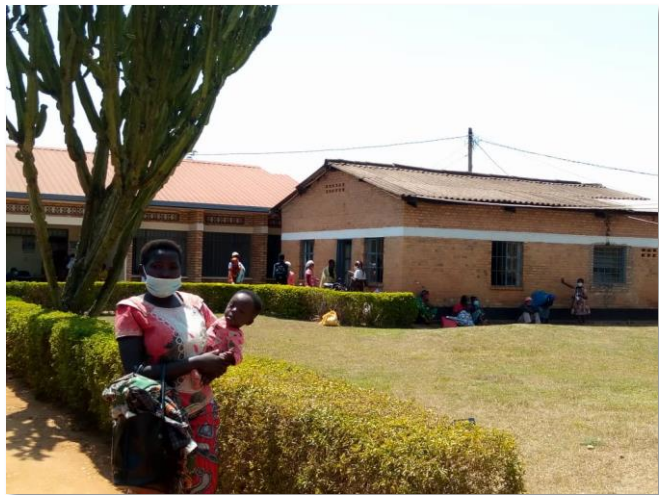
wachtende patiënten op de kleine schaduwplekken die er te vinden zijn ...