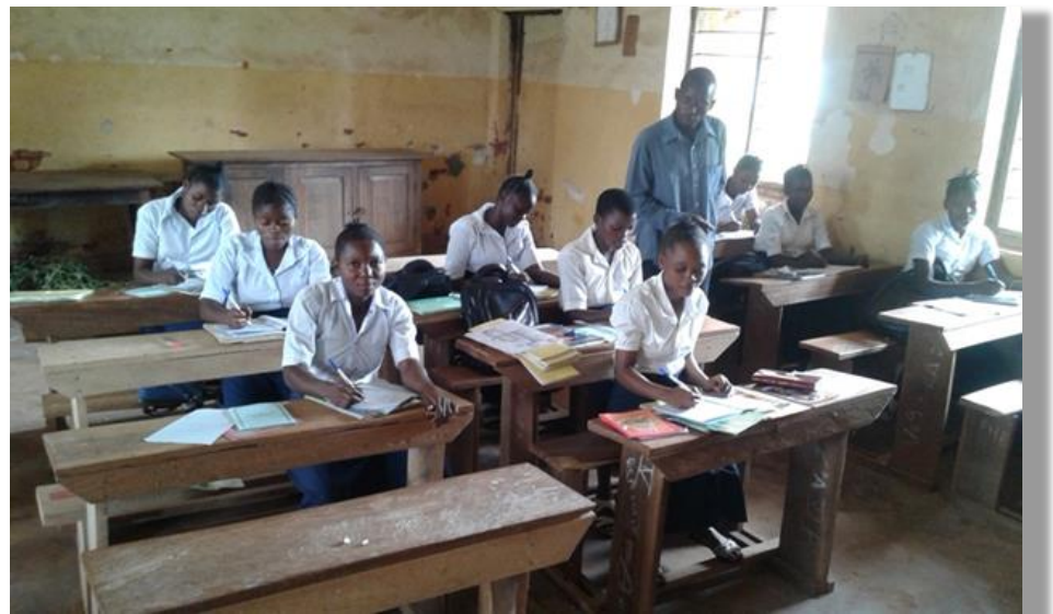
klas van het 6e jaar secundair snit en naad.