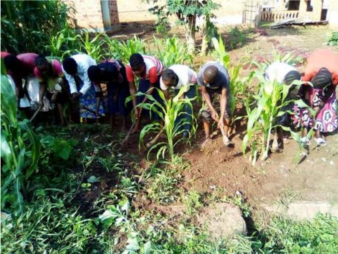
In het landelijke Bunkonde werken de leerlingen in de namiddag op het schoolveld

Aanvankelijk functioneerde de secundaire school (2014-2015) in de namiddag in de gebouwen van de lagere school. Op 5 september 2017 nam een Zuster van Liefde de directie over. De nood aan een eigen gebouw liet zich voelen; zij beschikten noch over aangepast meubilair noch over de nodige voorzieningen voor de afdeling snit en naad. Het gebouw (zie foto's) dat hen op het terrein van de missie toegewezen werd heeft een lange geschiedenis: