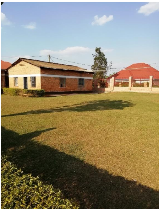
grasveld naast de kleine wachtzaal waarop de tent komt

Voorziene oplossing: voor de preventieve diensten wijkt men uit naar de naburige lagere school die gesloten was/is (de situatie verandert voortdurend). Als de scholen heropenen krijgt men een probleem. Met de hulp van ‘Solidariteitsprojecten N. – Z.’ zullen zij een vervallen gebouwtje opknappen dat de schoollokalen kan vervangen. Een tent op het grasplein zal dienst doen als ‘wachtplaats’ voor besmette personen. Dit vraagt de aankoop van een tent, een kunststof tuintafel en 50 tuinstoelen die kunnen ontsmet worden.