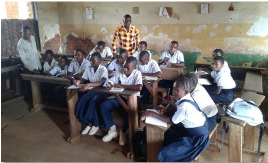
klas van 1 e jaar 'algemeen' secundair onderwijs.

Over de afdelingen zijn 158 meisjes en 10 jongens gespreid. Er wordt les gegeven van 7.15 u tot 12.45 u.