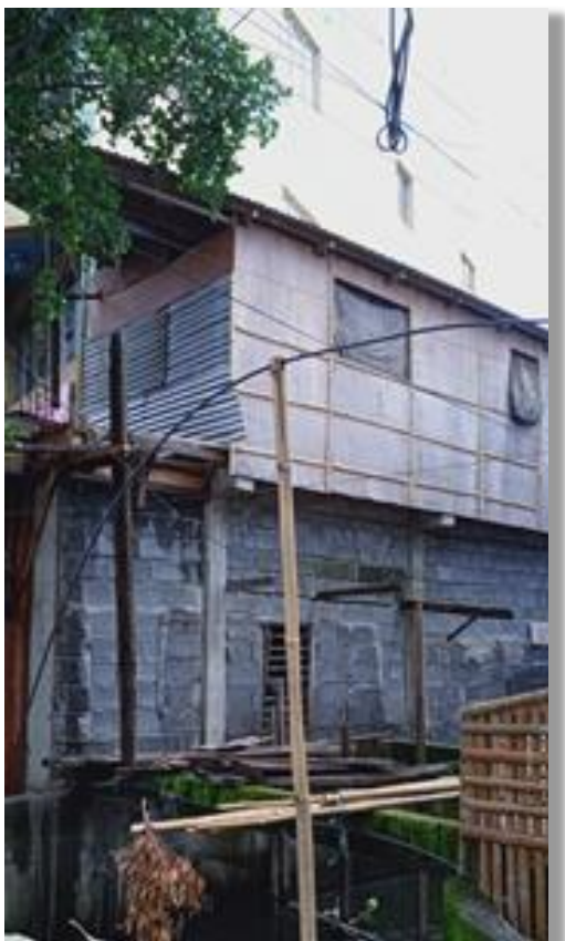
Zo ziet het er heel wat beter uit