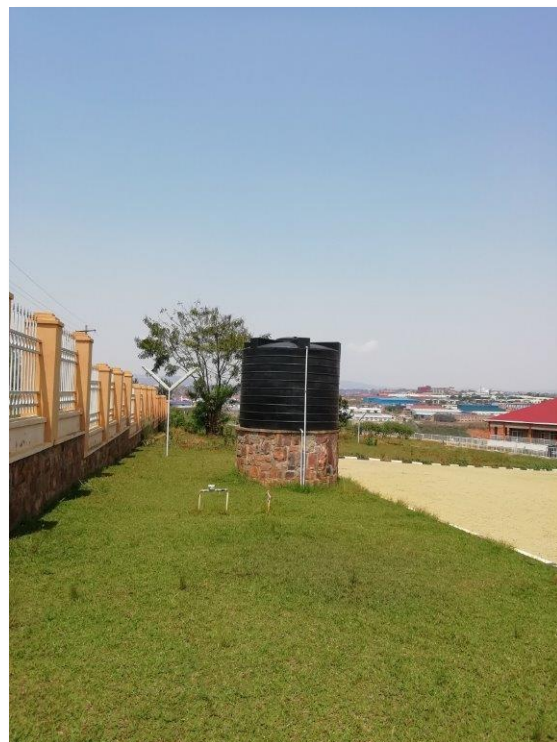
watertank waar het stadswater in toekomt, gelegen op het hoogste punt van de school waardoor hij fungeert als een soort watertoren

Omwille van de covid-pandemie werd door de overheid ook de verplichting opgelegd om een efficiënte installatie te voorzien voor het wassen en desinfecteren van de handen.