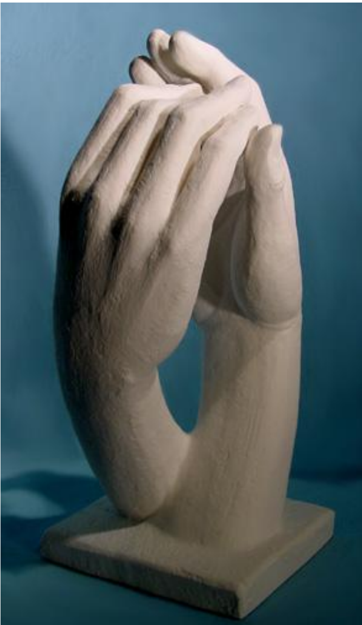
Auguste Rodin – La Cathédrale