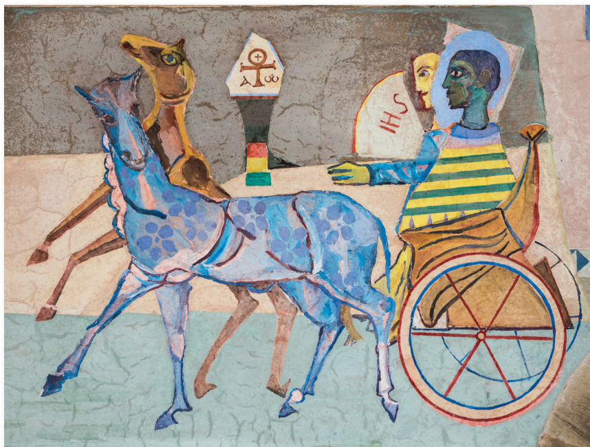
Bekering van de Ethiopiër. Fresco door Herbert Boeckl (abdij Seckau, Steiermark, Oostenrijk).

Je kan deze impuls gebruiken voor een uitwisseling in groep, tijdens een catechesemoment op zondag of op een ander moment in de week, ofwel kan je de inhoud ervan persoonlijk verwerken.