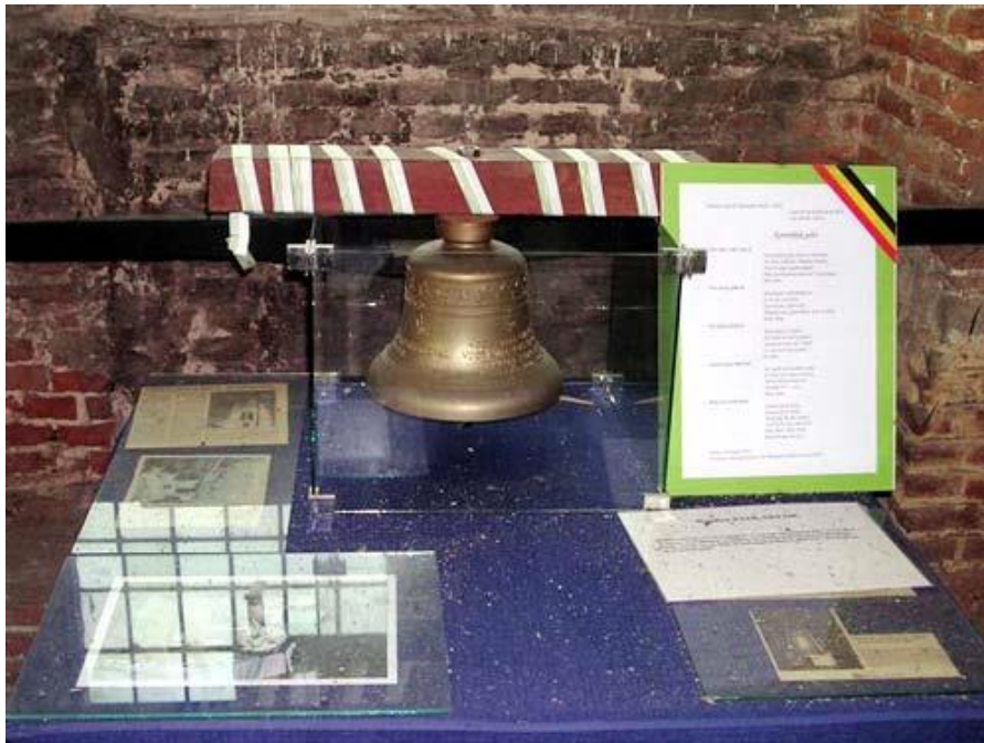
De kleine replica van de Koningin Paolaklok

zender (moederklok) die opgesteld staat in Mannheim (Frankfurt). Deze zender is een nauwkeurig tijdsbaken met slechts een tijdsafwijking van 1 sec./100.000 jaar!