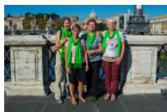
Enkele catechisten op bedevaart naar Rome met catechisten van bisdom Gent.