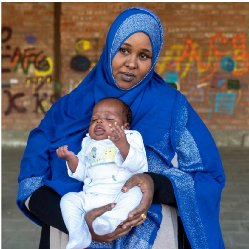
Fedasil Langemark Poelkapelle

Ik heb gehoord dat velen van jullie zitten te wachten op een wonder, jullie dromen daarvan, dat ik, jullie God, de wereld zal redden.