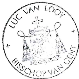
Aldus opgesteld Ludo Collin