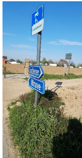
Sla hier rechtsaf