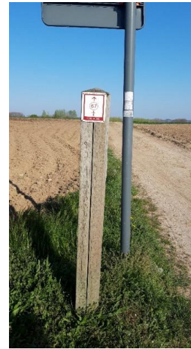
en volg wandelknooppunt 67