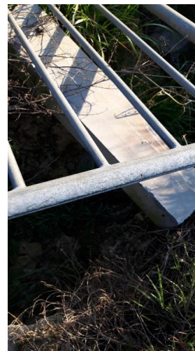
Puzzelstuk 10 + klein geschenkje: Hier doosje met puzzelstuk 10 zoeken en een ander doosje