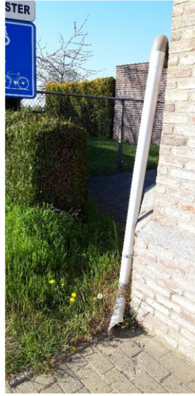
Zoek eerst Puzzelstuk 6 en ga rechts Heirebaan op