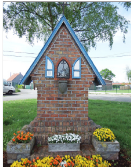
Foto 4 kruispunt Trilinkouter en Steenstraat Ertvelde