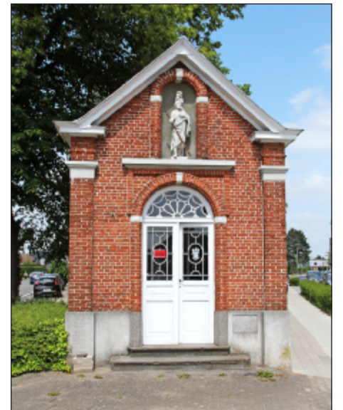
Foto 5 kruispunt Kapellestraat en Droogte Evergem