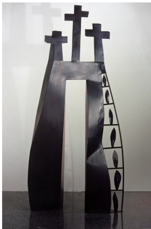
Angelo Casciello, °1957, Scafati, Italië GOLGOTHA - Beschilderd ijzer