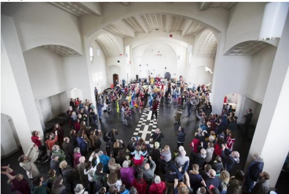
Circuskerk van Circusplaneet in de kerk van Malem (Gent)