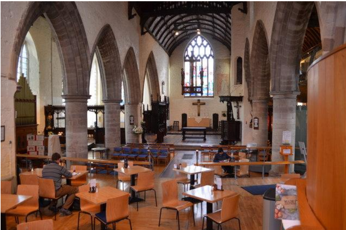
All Saints Church