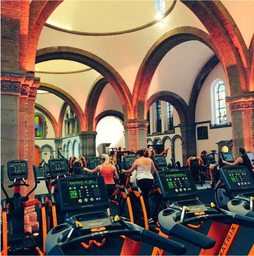
Van religieuze naar fysieke gezondheid in de Karmelietenkerk in Ieper