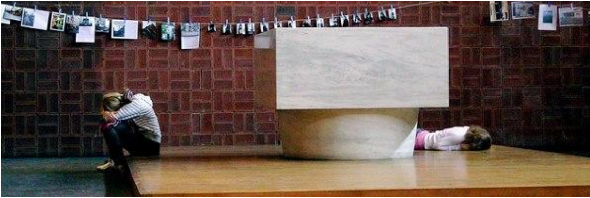
St. Helena in Bonn