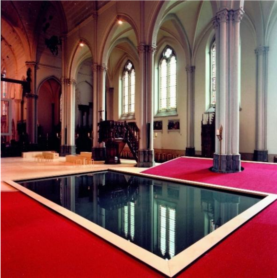
Symboolvlak in de Magdalenakerk in Brugge