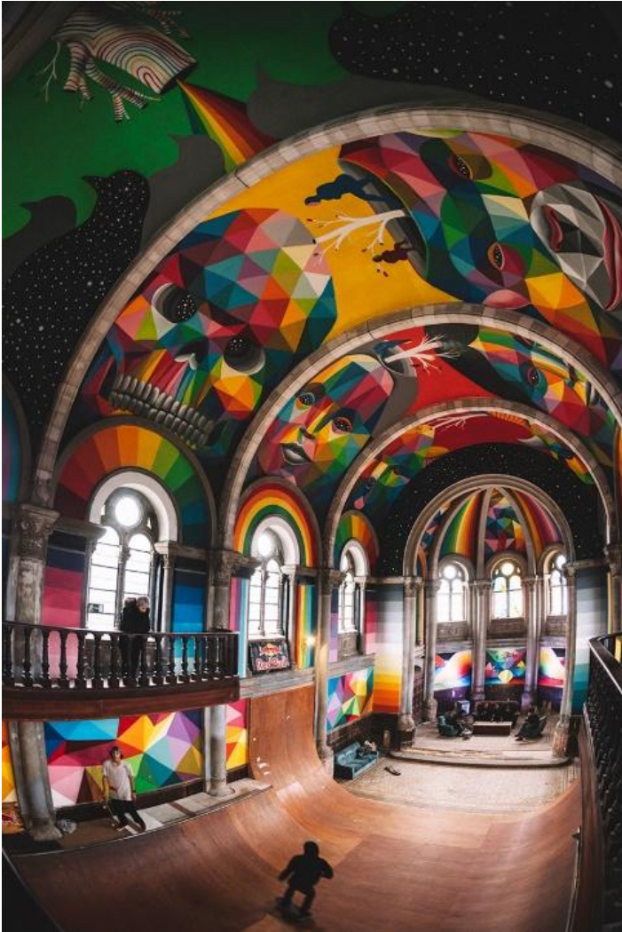
Sixtijnse kapel voor skaters