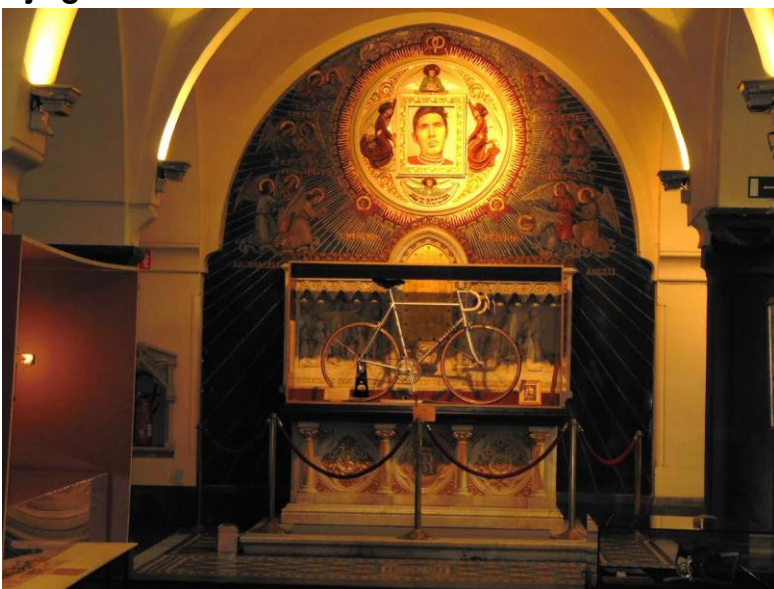
Hoogaltaar voormalige Paterskerk in Roeselare; nu museum Koers is religie.