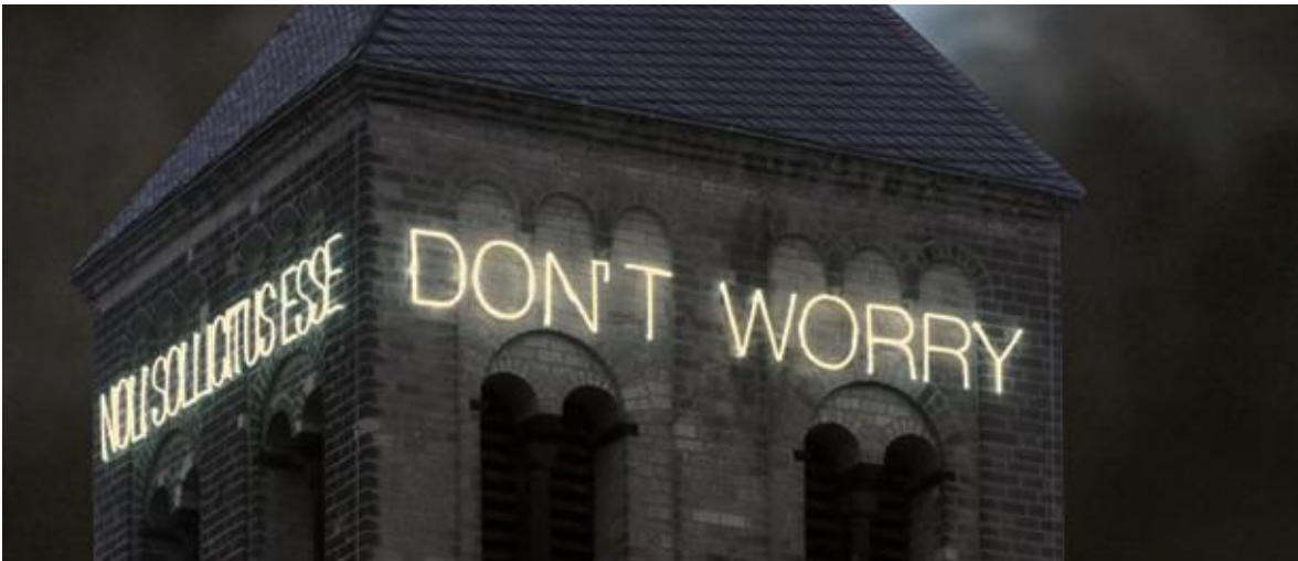
Het Kunststation St. Peter in Keulen