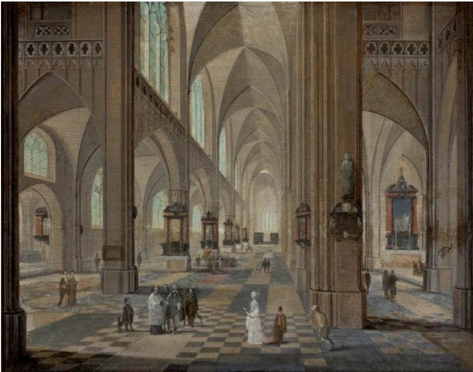
Pieter Neefs I, Interieur van de Onze Lieve Vrouw kathedraal, Antwerpen;

© http://en.wikipedia.org/wiki/Pieter_Neefs_the_Younger (20.02.2015)