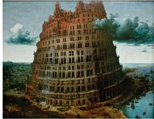
Toren van Babel, Pieter Brueghel de Oude