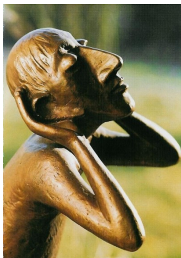
(beeld: Toni Zenz)

Hoor ons dan nu en roep ons weg uit chaos, ellende en matheid, raak onze veerkracht aan, raak onze veerkracht aan.